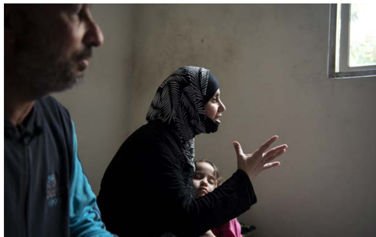
Liban. Dix ans dans la crise en Syrie, la famille des réfugiés lutte contre la pauvreté et les problèmes de santé mentale

La SMSPS est également pertinente pour d'autres objectifs tels que l'ODD 16 sur la justice, la paix et des institutions plus fortes.